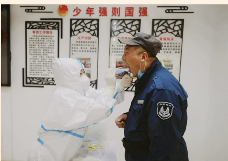
中海物业防疫不松动,落实常态化疫情防控,公司沈阳员工全部核酸检测上岗,树立物业服务“央企”标杆,获得《沈阳日报》等多家社会媒体报道。(高菲)