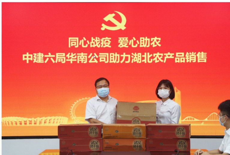
近日,中建六局华南公司举行“同心战疫 爱心助农”主题活动,帮助解决湖北农产品销售难题,以实际行动助力湖北疫后重建。(梁深圳)

老刘常挂在嘴上的一句话是,“多亏了国家的好政策,否则我们住的这旧小区哪里会发生这么大的变化哩?”(刘亮)