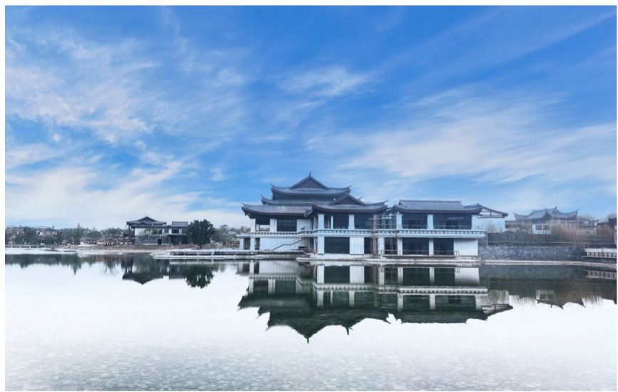
近日，中建一局一公司承建的成都融创文旅城六星酒店竣工。该工程总建筑面积7.04万平方米，酒店大堂建筑层高24米，为国内酒店之最。（曹雪娟）

凭江远望，扬帆领航，一座展示新区形象的门户地标已傲然矗立，成为长江之滨最动人的风景线，也昭示着新区面貌的日新月异。