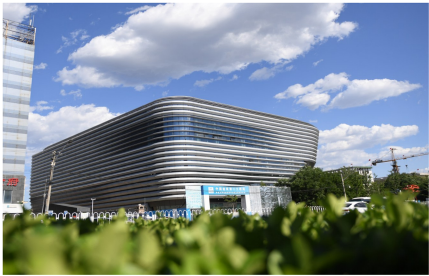
近日，中建二局三公司承建的国家体育总局冬季运动管理中心综合训练馆项目“冰场”竣工，成为2022年北京冬奥会第一个竣工的新建场馆。（闻江、蒋晓丽）