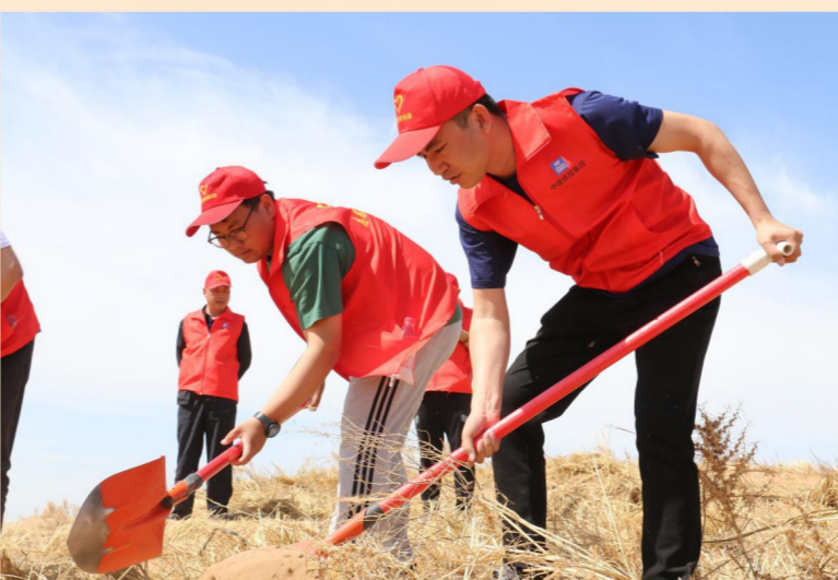
6月4日,中建铁投兰张三四线铁路项目青年志愿者前往武威市长城镇红水河东岸沙窝开展义务治沙活动。(陈葵、于秀华)