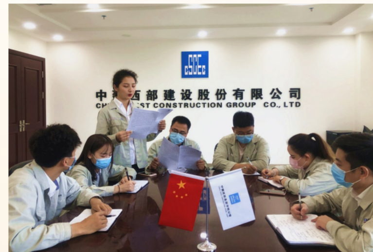
6月3日,中建西部建设乌鲁木齐预拌厂组织厂内维吾尔族、回族、藏族等少数民族青年认真学习领会习近平总书记全国两会期间重要讲话精神和全国两会精神。(靳梦茹)