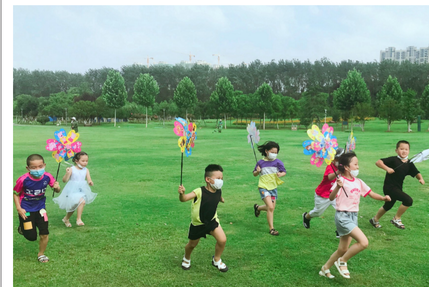
6月15日,中建西部建设“砼砼”志愿服务队青年志愿者带领武汉市江岸区金潭村的留守儿童走进大自然,组织安全知识小竞赛、风车趣味赛跑、丢手绢等趣味互动游戏。(汪曼、林婧)

剥离非优势业务,精准施策。“好钢要用在刀刃上”。在企业转型升级快车道上,有限资源“打向哪”非常关键,上海分公司紧跟国家投资发展战略方向,找准产业利润增长点,抓好技术创新,堵住持续吞噬企业资源的漏洞,在全面清理低效无效资产的同时,加速盘活变现,为企业开拓新领域新项目腾出了空间,将资源用在了“刀刃”上,精准施策,优化资源,实现新的发展,解决了资源用在哪的问题。