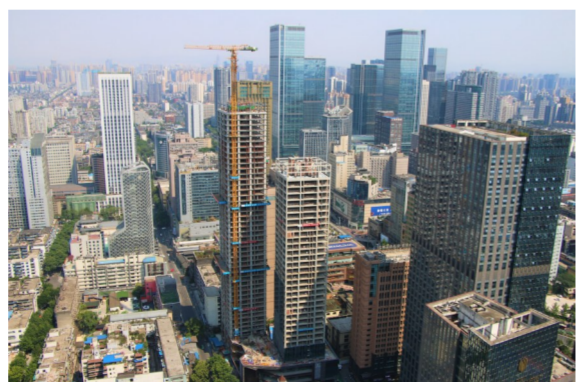
近日,由中建二局三公司承建的成都金融街·融御项目主体结构封顶。该项目由两栋超高层及附属裙房组成,是集商业、酒店、住宅于一体的城市综合体。项目建成后将对完善成都中心城区开放空间规划建设具有重要意义。(宋晓琳、税筱琴)