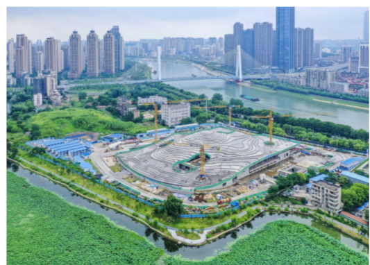
近日,全球首个地景式清水混凝土建筑——中建三局总承包公司承建的琴台美术馆项目进入装饰装修施工阶段。项目像一座布满梯田的山丘,是武汉市重点建设项目,总建筑面积4.3万平方米,预计将于今年内完工。(潘海亮)