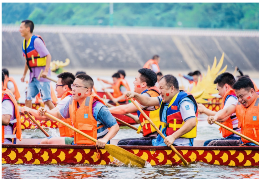
6月21日,中建二局华中分公司在长沙市浏阳赤马湖举办首届“攻坚杯”龙舟文化节暨建党99周年主题活动。8支队伍竞相角逐,用实际行动诠释同舟共济、奋勇争先的龙舟精神。(刘芳)