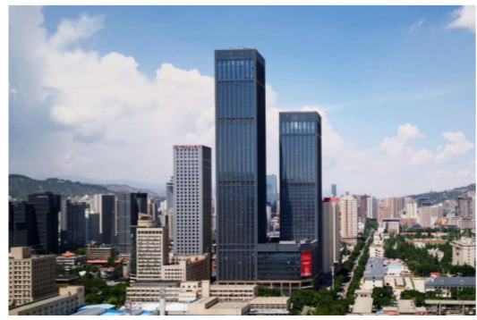
近日,由中建七局建筑公司承建的234.8米超高层——甘肃兰州盛达金城广场项目外幕墙整体施工已全部完成,为2020年顺利实现交付奠定了坚实基础。(王晨宇、刘亮)