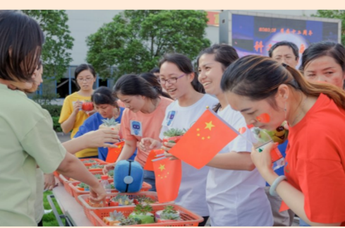
近日,中建科工华东钢结构公司开展“健康行”活动,职工们在丰富活动营造的欢快氛围中为祖国庆生。(袁茂磊、陈商尧)