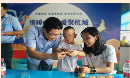
近日,中建市政公司杭州下城区三村改造项目举办“情暖中秋·爱聚杭城”幸福零距离系列探亲活动,员工和家属一起制作手工月饼。(侯立婷)