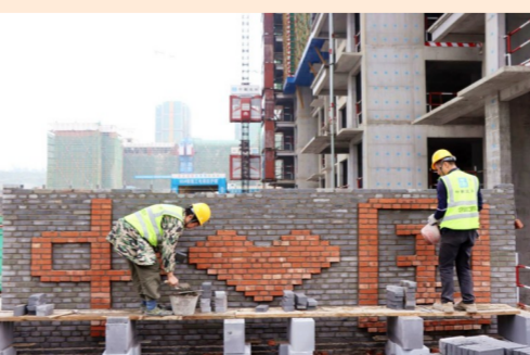
双节之际,坚守在十堰大洋五洲二期项目部的工人们砌起一面创意墙,传递对祖国的美好祝愿。(王琬、袁康琪)