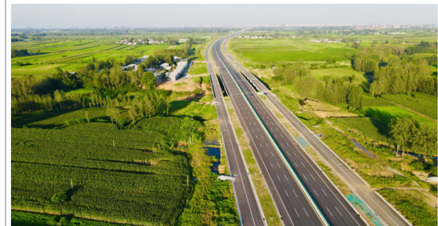
近日,中建七局交通公司驻马店项目省道331线驻马店市平山大道交叉口至原七蚁路改建工程顺利交工验收,为下一步通车打下坚实基础。(商庆娟)