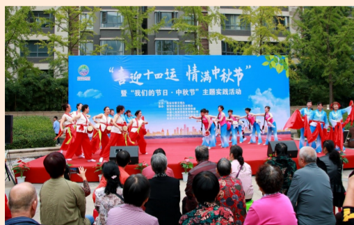
9月25日,中建七局四公司承办西安市“喜迎十四运 情满中秋节”活动,公司志愿者走进社区,与居民们共享中秋文化大餐。(陈春春、王帅)