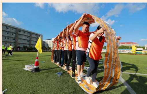
9月26日,中建港航局举行“蓝海远航”运动会,在破冰游戏、月饼大战、烽火前行等活动中,活跃节日气氛,熔炼团队精神。(黄滢滢)