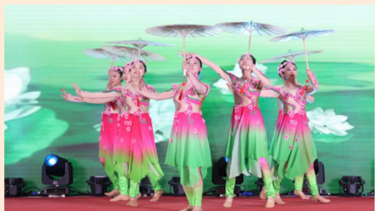
9月25日,中建一局在北京广发金融中心项目举行2020年中秋国庆慰问演出,近万名观众在线观看,共享节日氛围。(杨亚凯)