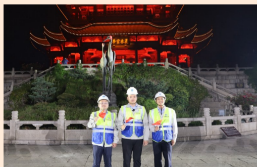
10月1日晚,中建三局“两山”医院建设者代表与“抗疫天团”在黄鹤楼合唱《国家》,铭记武汉战疫岁月,为祖国庆生。(陈朝阳)