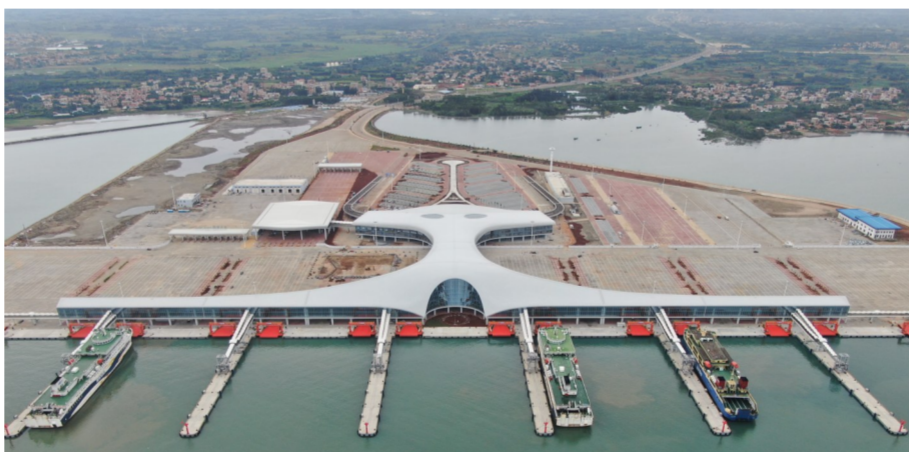
9月26日,琼州海峡交通大动脉徐闻港首艘轮渡“紫荆22”一声鸣笛,乘风破浪驶向海南,标志着中建三局承建的全球最大客货滚装码头湛江徐闻港正式通航。(彭初)