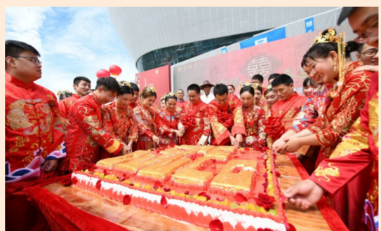
近日,在中建四局成都高新区体育中心项目,22对新人举办中式集体婚礼。新人坐花轿、牵绣球、跨马鞍、点红烛,开启新生活。(李安心、王曦)