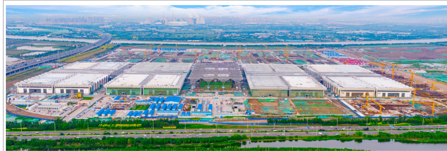
近日,由中建八局承建的国家会展中心(天津)项目迎来重要建设节点,一期主体结构完工并顺利通过验收,二期项目正在进行地下基础施工,项目全面进入高效建设阶段。该项目总建筑面积134万平方米,建成后将成为中国北方最大的国家级会展中心,对优化我国会展业发展布局具有重要意义。(梁雪、李娜)

中建方背负着家国情怀,承载着光荣与使命,服务支持滨海新区发展,探索中国新型城镇化的未来,是建人身为央企排头兵的重要使命和责任。中建方将继续为滨海新区的发展承担责任,贡献力量。