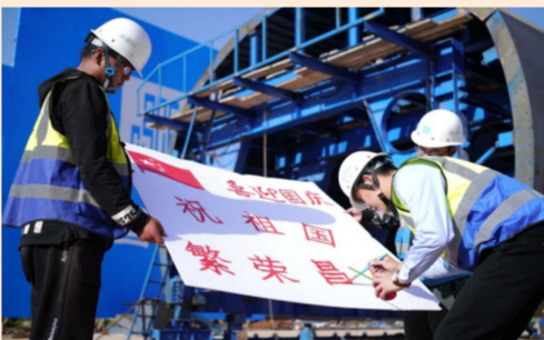
青海省海东市互助土族自治县海拔3280米的施工现场,中建二局200多名员工持续坚守,他们用红色油漆作画,欢度国庆。(马小军)