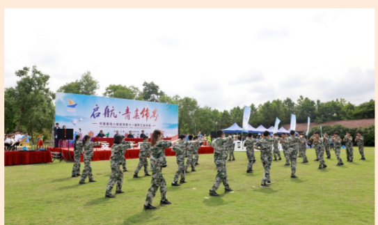
近日,中建八局装饰公司“启航·青春饰界”职工运动会上发布“金羽筑爱”公益品牌,所得捐款将赠予对口帮扶的甘肃卓尼县的孩子。(李淑韩)