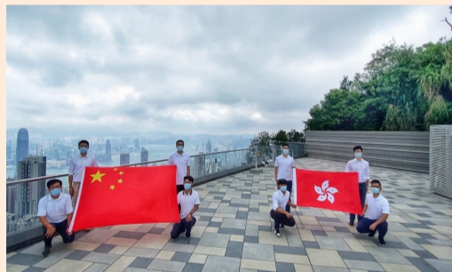
近日,中国建筑志愿营驻港青年及港聘员工代表前往香港多个地标开展“歌唱祖国·献礼国庆”活动,嘹亮歌声在香港多地飘扬。(陈佩瑶)

关心、照顾孤寡老人,不仅是中建桥梁以实际行动弘扬中华民族尊老爱老传统美德的体现,更是践行中建六局“厚德、笃行、创新、共生”理念的重要体现。(曾 艳)