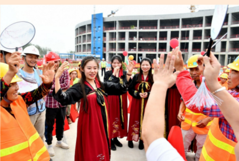
9月29日,中建五局安徽公司文艺小分队来到项目工地演出,庆祝国庆、中秋佳节,给独在异乡的工友带去归属感。(徐 辉)