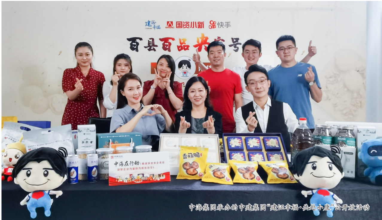
中海集团承办的中海集团“建证幸福·共赴小康”云开放活动