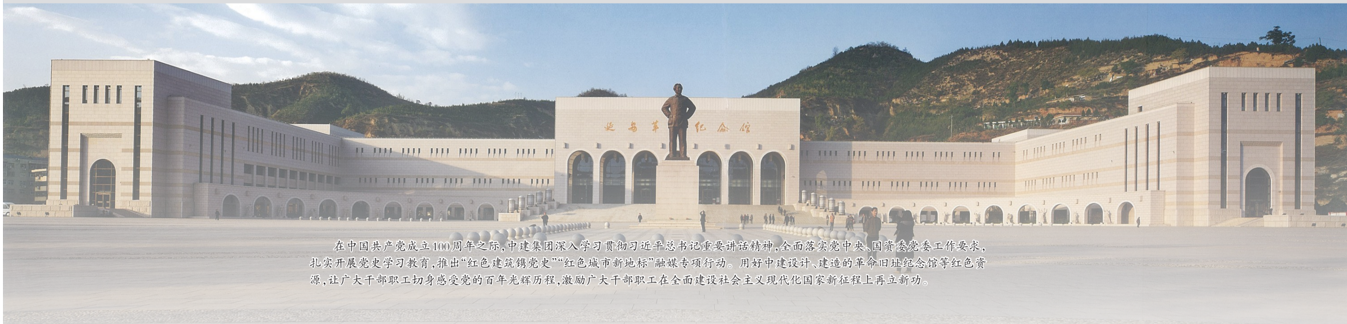
在中国共产党成立100周年之际,中建集团深入学习贯彻习近平总书记重要讲话精神,全面落实党中央、国资委党委工作要求,扎实开展党史学习教育,推出“红色建筑铸党史”“红色城市新地标”融媒专项行动。用好中建设计、建造的革命旧址纪念馆等红色资源,让广大干部职工切身感受党的百年光辉历程,激励广大干部职工在全面建设社会主义现代化国家新征程上再立新功。