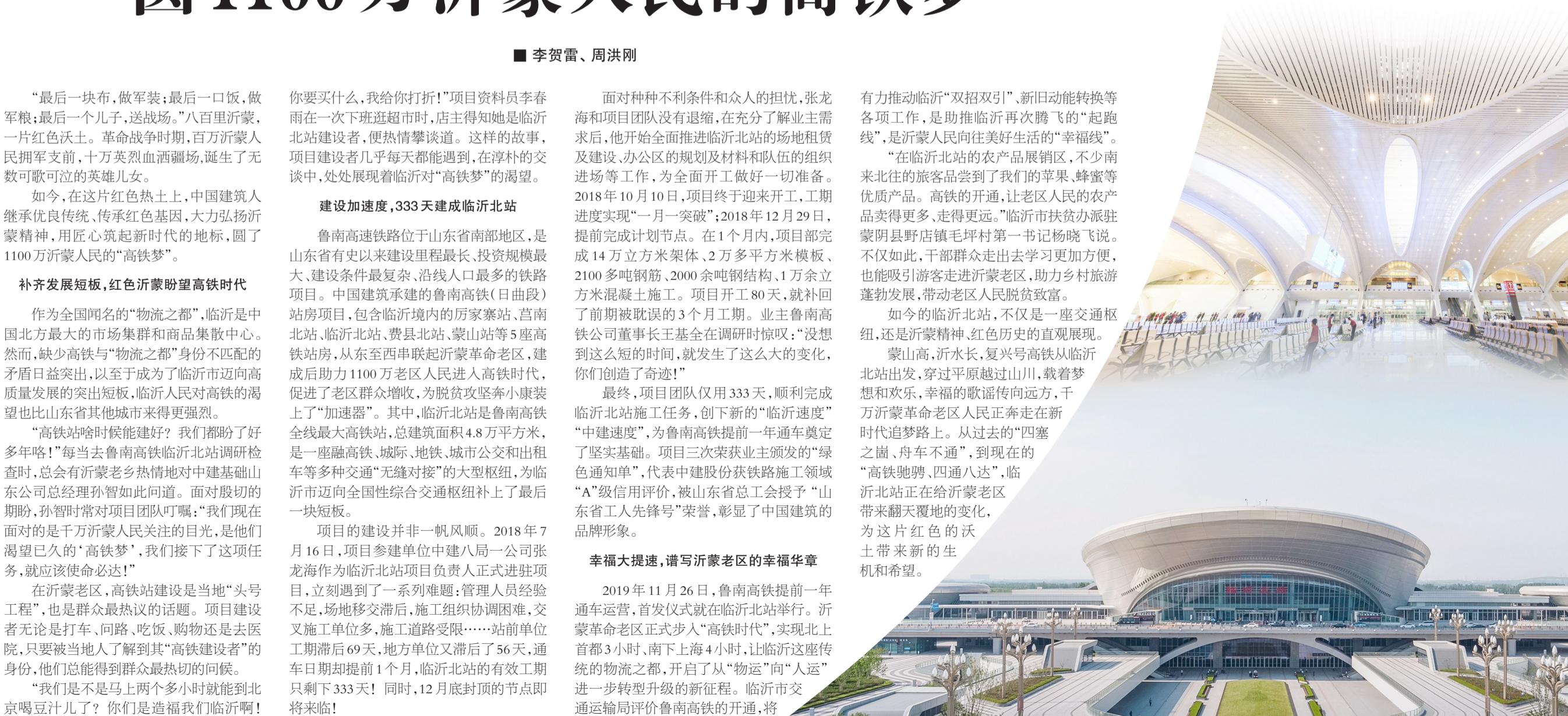
建证百年 同心筑梦