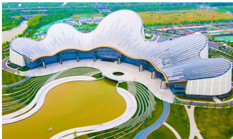
近日,中建二局投资、建设、运营的南京华谊电影小镇正式开园。项目以影视与旅游产业双核驱动,集商业、文化旅游、演艺、餐饮等产业于一体,园区内涵盖丰富的IP衍生品生态产品,致力打造极富特色的民国主题文旅新地标。