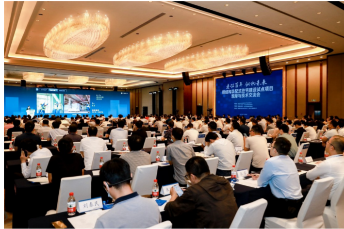
钢结构装配式住宅建设试点项目技术交流会

工程采用EPC总承包管理模式,在方案设计阶段,项目团队针对已投入使用的保障房进行实地调研,拜访8个小区71家