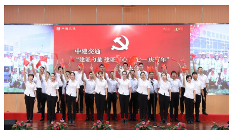
中建交通党员职工共唱红歌,“声”情告白党和祖国。

深入践行为民服务,激励实干担当。努力践行以人民为中心的发展思想,站稳人民立场,贯彻党的群众路线,尊重职工群众首创精神,扎实开展“我为群众办实事”实践活动,解决好职工群众“急难愁盼”,推出一项项为民、便民、利民、惠民的务实举措,推动职工的全面发展。把党中央的号召、集团党组的殷切期盼,落到实处,干到实处,全面完成全年各项目标任务,以优异成绩庆祝建党100周年!