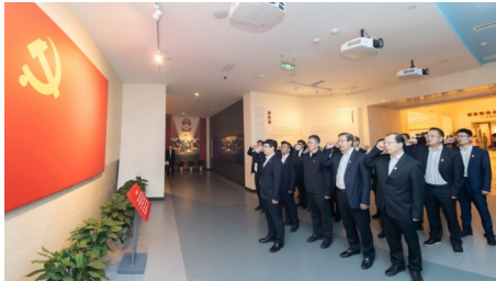
中建三局领导班子成员参观中国共产党纪律建设历史陈列馆,重温入党誓词。

坚持知行合一,锚定发展目标。聚焦高质量发展主题,抓紧抓实国企改革三年行动,扎实推进“六个专项行动”,聚焦“一创五强”战略目标,全力落实“166”战略举措,紧扣“六个致力”,抓好“六个突出”,高效推进中建三局“134”改革三年工程。更加坚定“成为受人尊敬的一流企业”的价值追求,积极投身建设“高质量万亿三局”的探索实践,在新征程上更加坚决地扛起中央企业“顶梁柱”的职责使命,发挥好国有经济战略支撑作用,为国有资产保值增值贡献三局担当。