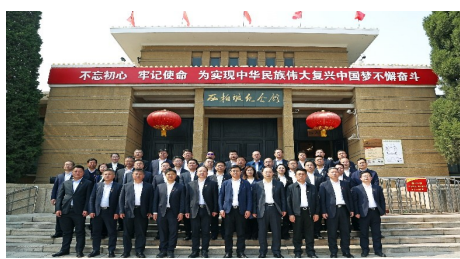
中建六局党委开展“弘扬西柏坡精神 践行新发展理念”党史学习教育主题党日活动的合影。

站在“两个一百年”奋斗目标历史交汇点上,我们将继续弘扬光荣传统、赓续红色血脉,将学习贯彻习近平总书记“七一”重要讲话精神同推动企业高质量发展结合起来、同高质量开展党史学习教育结合起来,以中建集团“一创五强”战略目标为引领,完整准确全面贯彻新发展理念,聚力实施《国企改革三年行动方案》,“对标世界一流管理提升行动”以及集团“166”战略举措、“中建136工程”,全面推进“五个建造”,厚植“中建信条·共生文化”,奋力实现六局“12615”“三年大变样”奋斗目标,朝着创建世界一流企业目标砥砺前行,在建设社会主义现代化国家的新征程中展现更大作为。