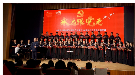
中建西北院党委庆祝中国共产党成立100周年“永远跟党走”红色音乐主题党课。