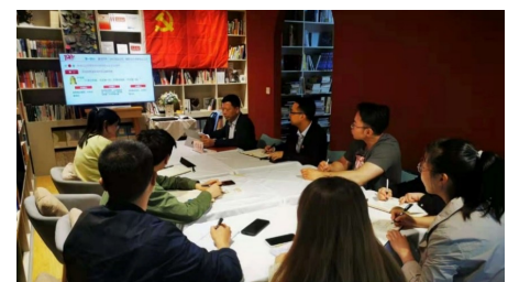
中建市政西北院党委书记为党支部党员讲授专题党课。

通过近一段时间的反复学习,我感到作为央企负责人,必须要把学习贯彻习近平总书记“七一”重要讲话精神作为当前和今后一个时期的首要政治任务抓实抓好。一是要着力以“学”字为基,掌握核心要义,深刻领悟习近平总书记“七一”重要讲话的深邃内涵;二是要着力以“实”字为先,强化措施举措,不断丰富“1+5+2”的特色机制,不断增强党史学习教育的吸引力和感染力,持续推动党史学习教育走深走实;三是要着力以“干”字为要,切实担当作为,聚焦充分发展、平衡发展、协调发展、匹配发展,统筹推进国企改革三年行动、“六个专项行动”等重点任务,不断提升企业管控力、市场竞争力、数字支撑力、行业影响力,夯实高质量发展基础,带领中建市政西北院2600余名员工,以史为鉴、开创未来,奋力开创企业改革发展新局面,加快建设基础设施领域世界一流设计集团,为助力集团实现“一创五强”战略目标、确保“166”战略举措落地、全面建设社会主义现代化强国贡献市政西北院力量。