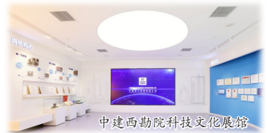
中建西勘院科技文化展馆

企业向心力展现新气象。出台《健康可持续发展指导意见》，作为管理行为的原则性指引。在以“尚真·有为·守正”为品格内涵的“中建信条·尚真文化”基础上，打造“尚真文化+”平台，发挥文化铸魂、文化赋能功能。院科技文化展馆入选首批中国建筑爱国主义教育基地，亮相国务院国资委“百年峥嵘 初心见证”中央企业红色资源网络展览。2020年，院获评第五届四川省文明单位。