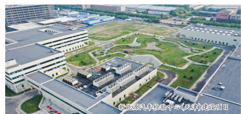
新能源汽车检验中心(天津)建设项目

“双碳”目标下,新能源汽车巨大的发展潜力也带动了相关配套检验产业的加速升级。2020年10月,新能源汽车检验中心(天津)建设项目开工。项目总建筑面积约14万平方米,主要围绕燃料电池汽车、新能源汽车电磁兼容、动力电池、电驱电控、充电技术五大领域,全力打造服务于新能源汽车“研发全流程链、全产业链、全生命周期、全应用领域”的综合测试评价基地,建成后将为