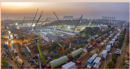
火神山医院建设现场