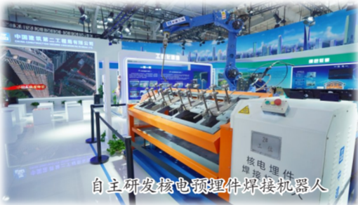
自主研发核电领件焊接机器人

中建二局以建筑排头兵的气概,策马扬鞭奋蹄,将总部迁址首都北京,成为当时系统内唯一在国家工商总局注册企业。以市场为导向、以资产为链接、以效益为准绳,优化经营结构,创新实施“大市场、大业主、大项目”经营思路,推进组织结构扁平化、人财物管理统一化、项目管理法人化,生产经营不断取得新突破。