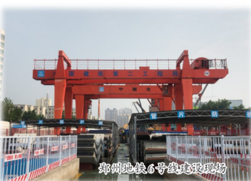
郑州地铁6号线建设现场

构持续优化。企业主要经济指标连年创历史新高,实现“北京保第一、全国争前五”奋斗目标。