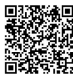
扫码关注更多资讯

下一步,中建技术中心(中建产研院)将深度参与建设,探索国家级创新平台运营管理新模式。同时,公司还将牵头组建“建筑产业互联网”专业实验室,搭建建筑产业互联网平台,参与建设“工程大数据与服务平台”等“4个共性技术实验室”,在数字建造领域开展产业前沿引领技术和关键共性技术研发,助推数字建造技术加速升级。