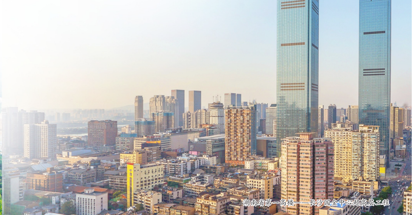
湖南第一高楼——长沙国金中心超高层工程