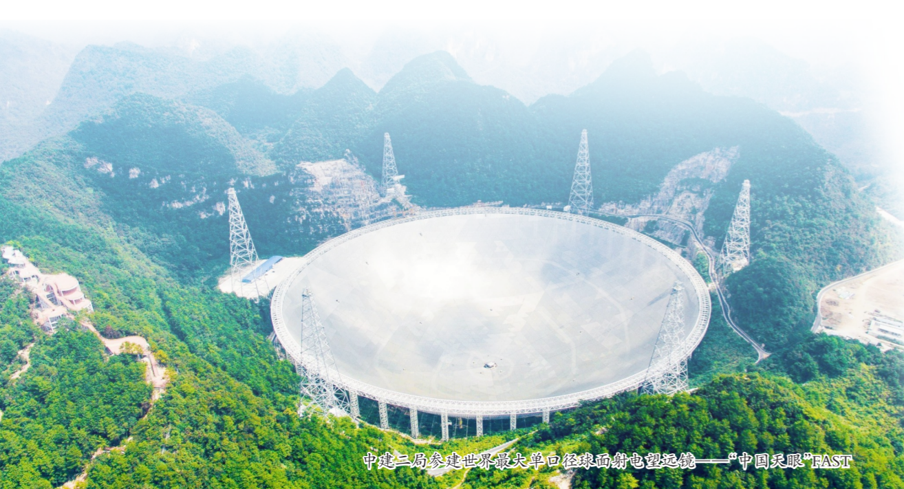
中建二局承建世界最大单口径球面射电望远镜——“中国天眼”FAST

看今朝,奋进征程路。一代代二局人血脉传承、笃行不怠,七十年奋斗正青春、七十年拼搏正当时。迈上新征程,中建二局将坚持以习近平新时代中国特色社会主义思想为指导,全面贯彻党的十九大和十九届历次全会精神,不断增强“四个意识”,坚定“四个自信”,做到“两个维护”,捍卫“两个确立”,胸怀“国之大者”,完整准确全面贯彻新发展理念,按照集团做强做优做大企业“六个必须”的总体要求,传承弘扬“忠诚担当、使命必达”的中建精神,奋力打造高质量发展的一流核心工程局,助力实现集团“一创五强”战略目标和“166”战略举措,为全面建设社会主义现代化国家作出新的更大贡献。