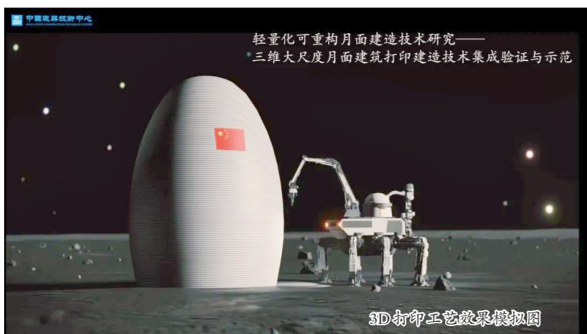
轻量化可重构月面建造技术研究——“三维大尺度月面建筑打印建造技术集成验证与示范”