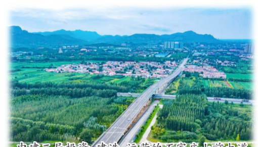
中建二局投资、建造、运营的石家庄山前大道

忆往昔,峥嵘岁月稠。一代代二局人立心铸魂、为国担当,无论是卸甲从工、远赴东北,建设一汽、一重,还是千里跋涉、离城进山,保质保量完成“三线建设”任务。无论是挥师冀东,参加唐山震后援建,还是在改革开放后率先出征深圳特区、勇敢坚定地搏击商海,在无数次大战大考中为国而战、为国担当,中建二局都能够敢于肩负起历史重任并发挥重要作用,坚定地履行党和国家所赋予的重任。