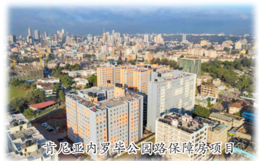
肯尼亚内罗毕公园路保障房项目

深耕基建领域，中建七局持续打造以公路、桥梁、地铁、隧道等为核心的优势产品。湖北保神高速、曲靖三清高速、郑州南四环等一大批民心工程交付通车；郑州地铁6号线、青岛地铁9号线、长春地铁9号线加速建设，书写“地下长龙”的奇迹。