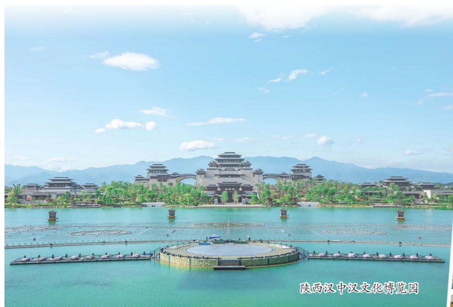
陕西汉中文化博览园

七十年筚路蓝缕、奋勇图强，七十年栉风沐雨、勇立潮头。站在中国建筑组建40周年、中建七局成立70周年的重要历史节点之上，中建七局将深入贯彻落实习近平新时代中国特色社会主义思想，围绕中建集团“一创五强”战略目标，聚焦“三个致力”，推进“四个管理现代化”，奋力书写高质量发展新篇章，以实际行动迎接党的二十大胜利召开。