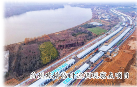
嵩州渡桥临时流调观察点项目

身着军装，七局人留下了“顾全大局、听从指挥、遵守纪律、吃苦耐劳”的美名。兵改工后，七局人传承基建工程兵红色基因，孕育提炼出“砺进·共赢”文化，始终践行着“共和国长子”的责任使命。