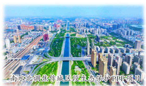
高水北调焦作城区段生态保护PPP项目

2022年9月，郑州滨河国际新城游人如织、车水马龙，16.77平方公里的土地上，56公里通达路网、1200亩生态水系、5500亩“城市绿肺”、医疗、教育、商业资源聚合成链……这是中建七局投资、建设、运营的现代化产业新城典范，也是企业转型发展的缩影。