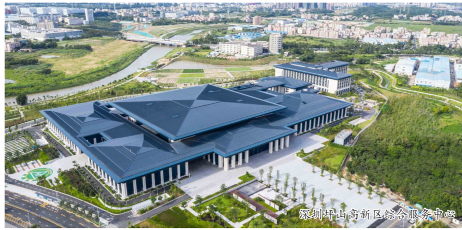
深圳坪山高新区综合服务中心

2017年,国务院办公厅《关于促进建筑业持续健康发展的意见》、国家标准《建设项目工程总承包管理规范》正式发布,中建科技抓住政策红利,依靠自身的实力和行业引领优势,顺利在深圳坪山区承接了全国首个