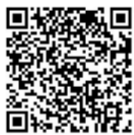
扫码关注更多资讯

从愚公移山的神话故事，到如今建筑物的整体迁移，中国建造以科技创新引领行业变革发展，描绘着时代之潮、发展之潮、追梦之潮。中国建设者们以可靠的双手，浇灌中国新形象，以最沉稳的画笔，勾勒大地新面貌。未来经过这里的长途车和高铁将共同见证由中国建设者们创造的神奇时刻！