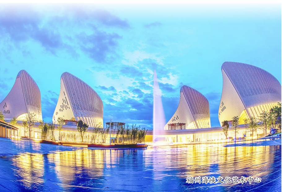
福州海峡文化艺术中心