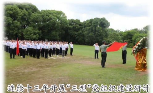
连续十三年开展“三型”党组织建设研讨

践行“以人为本”的人才理念。中建七局树立重实干、重实绩、重担当的选人用人导向，持续加大优秀干部发现培养使用力度，打造高素质领导团队。注重人才培养顶层设计，发布《“十四五”人力资源专项规划》，明确人才发展方向，搭建“青云计划”培养体系，分级分层落实人才培养工作，动态建立一支充满活力的人才队伍，为企业实现高质量发展和转型升级提供坚实的人才保障。