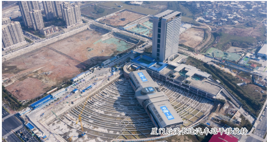
厦门后溪长途汽车站平移现场

为了保证福厦高铁的顺利建设，厦门后溪长途汽车站要么“拆”，要么“搬”。面对这两种方案，中建一局建设团队 members 们头脑风暴，最终决定为这座