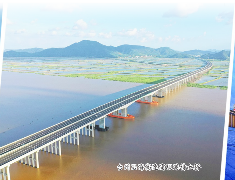
台州沿海高速甬甌跨海大桥