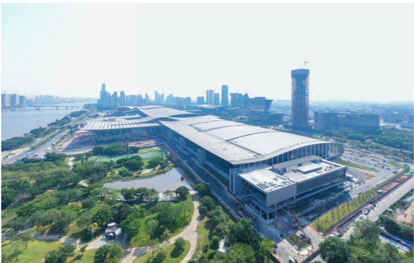
近日,中建八局承建的广交会展馆四期项目首展在即。项目总建筑面积约56万平方米,建成后将新增展位6000多个,助力广交会展馆成为全球规模最大、功能和配套设施完善、各类会展活动最活跃的会展综合体。(王敏达)