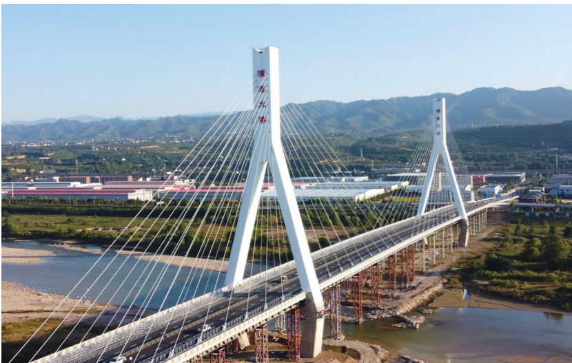
近日,中建七局承建的陕西宝鸡清溪渭河大桥迎来全线通车。大桥主线道路全长1830米,其中主桥全长1106.3米,为双塔双索面斜拉桥。通车后能有效解决宝鸡市区南北交通拥堵问题,推进渭河两岸经济发展。(孙文奇)

近日,中建科工上海外国语大学附属外国语学校松江云间学校交付启用。项目是上海松江区基础教育资源建设中,迄今投资总量最大、设计标准最高、配套设施最全的项目。(小钢)