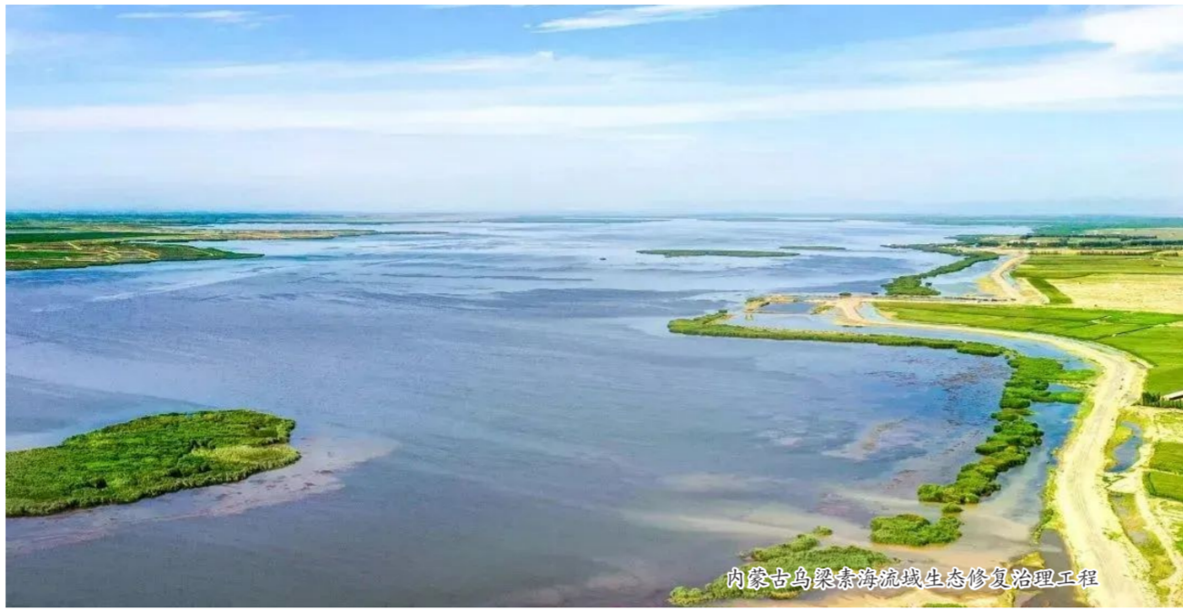
内蒙古乌梁素海流域生态修复治理工程

梁素海通过综合施策、标本兼治,生态环境不断改善,水质总体好转,稳定在V类,局部区域优于V类,水面面积稳定在293平方公里,生物多样性持续恢复,重现“塞外明珠”美景。