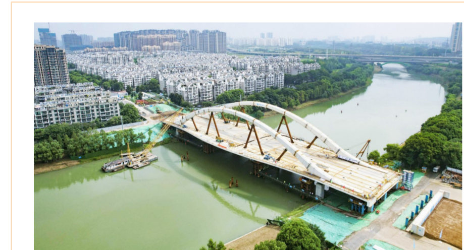
由中建三局承建的南京市梅苑南路跨秦淮新河大桥项目顺利完成南京市重量和顶推距离最大的钢结构桥梁顶推施工。项目位于南京市雨花台区“两桥”地区,全长850米,线路设计车速为40公里每小时。项目建成后,将打通秦淮新河南北两岸出行通道,缓解交通压力。(徐娇妍)

铸百岁伟业,驰九州通途。15年过去了,中国建筑的建设者们仍躬耕于山城脚下,践行着集团“一六六”战略路径,担当着传统基建市场的骨干力量,为推进新重庆建设全国交通第四极,打造国际性综合交通枢纽城市做出积极贡献。