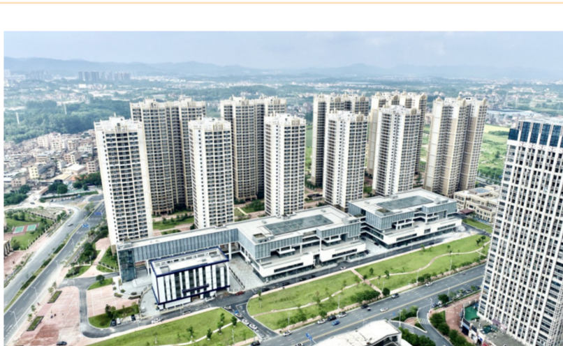
由中建四局承建的广州北站综合交通枢纽开发建设安置区项目正式交付,4727套安置房陆续全部移交回迁村民。项目位于广东省广州市花都区,总建筑面积约89.7万平方米,建成后将充分提升安置区居住品质,推动广州北站综合交通枢纽开发建设项目建设。(陈殊杉)