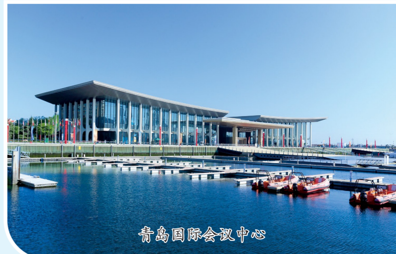
青岛国际会议中心