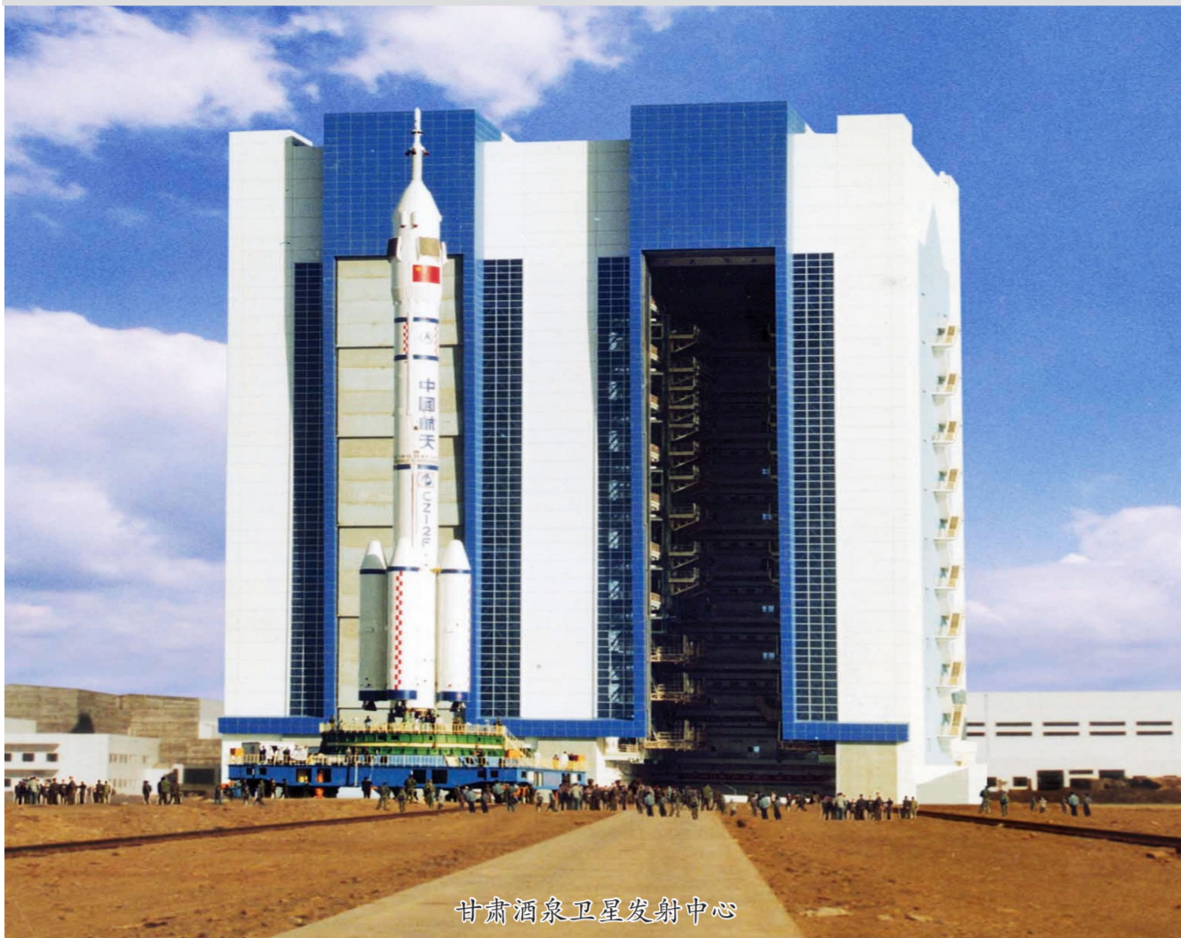
甘肃酒泉卫星发射中心