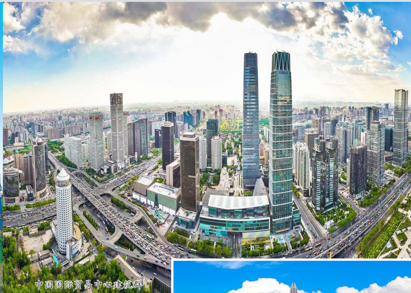
中国国际贸易中心建筑群