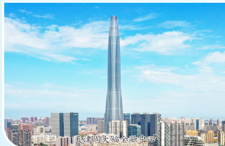
天津周大福金融中心

莫道万里征途远，厉兵秣马再启程，40年砥砺前行绘就壮美画卷。未来，秉承“军魂匠心 家国情怀 令行禁止 使命必达”铁军文化的中建八局，在实现“三标杆 两示范”世界一流投资建设集团的新征程上阔步前行，勇当中国建筑创建世界一流示范企业的标杆。