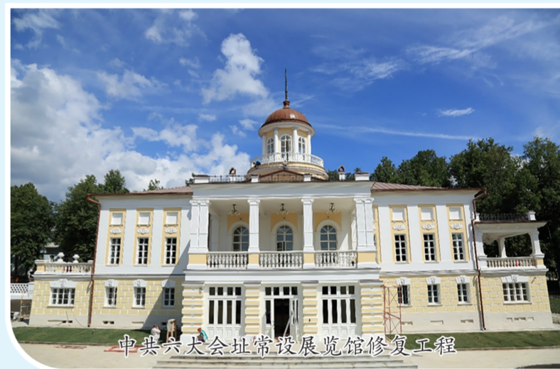
中共六大会址常设展览馆修复工程