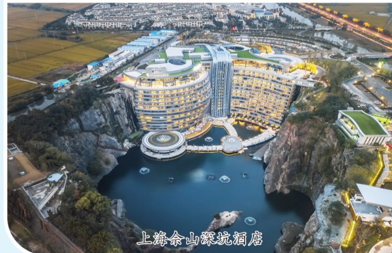
上海佘山深坑酒店