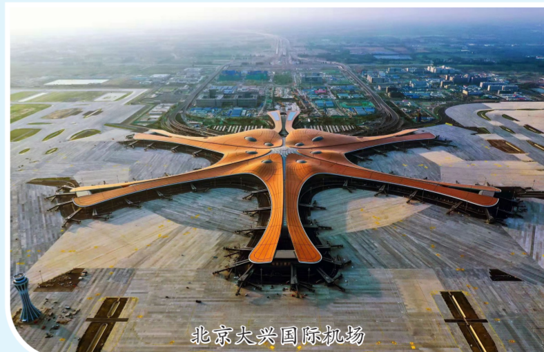
北京大兴国际机场