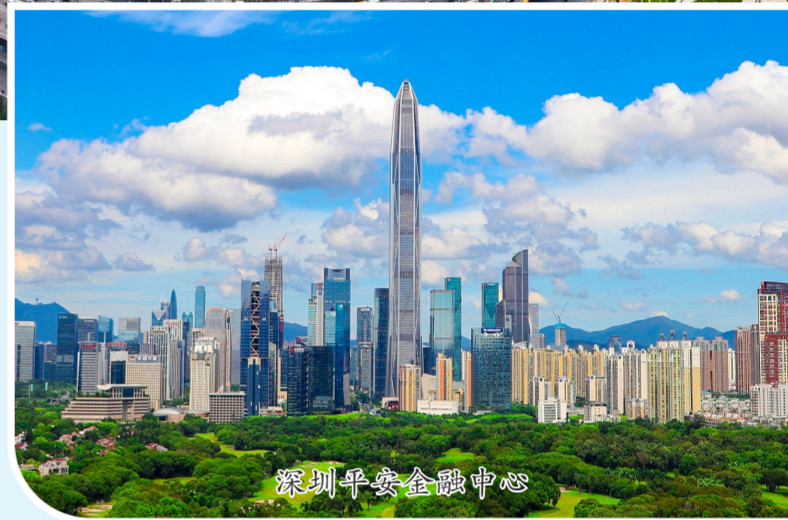
深圳平安金融中心