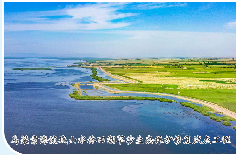
乌梁素海流域山水林田湖草沙生态保护修复试点工程